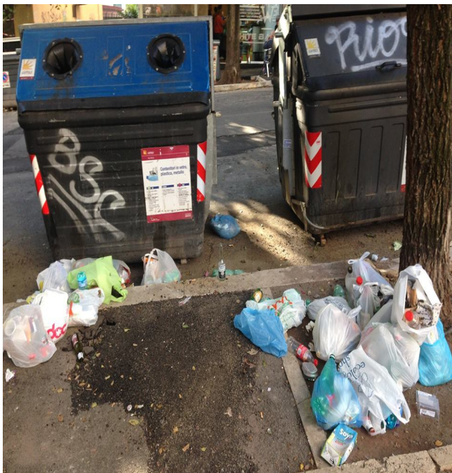
9 ottobre 2014, ore 9,00 Via Ozanam