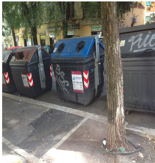
9 ottobre 2014, ore 12,00 Via Ozanam